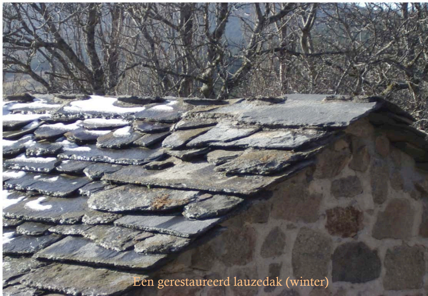
Een gerestaureerd lauzedak (winter)